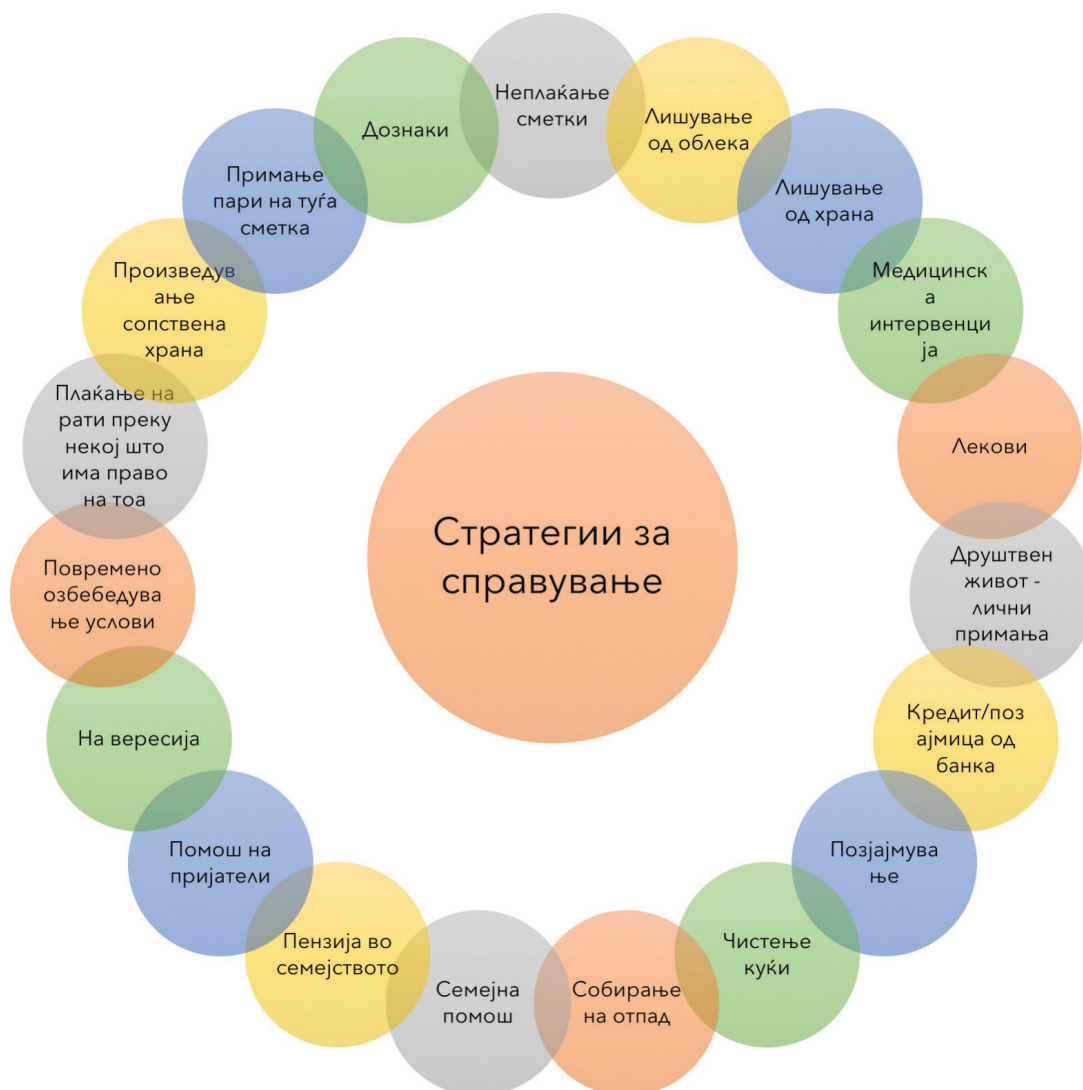
Слика.2 Стратегии за справување на испитаничките и испитаниците