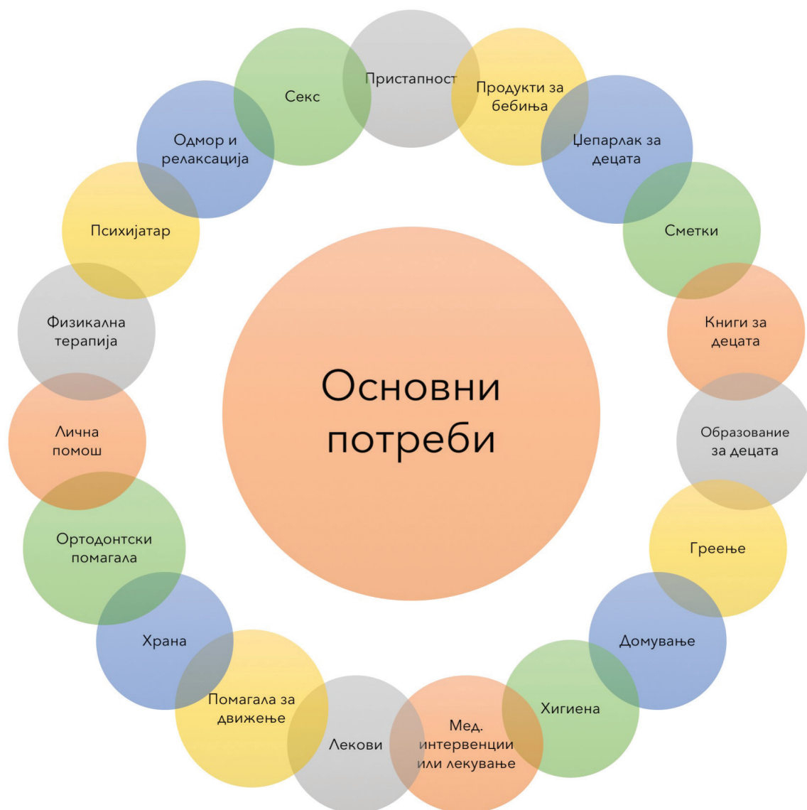
График бр.1 Основни потреби на испитаничките и испитаниците

“Немаме добиено социјална помош веќе два-три месеци. И кога конечно ќе решат да уплатат, плаќаат само за еден месец, не за три. Често е така. Понекогаш не можам ни лекови да купам за детето”